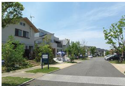
hit 大野城住宅展示場 所在地：大野城市南大和利一丁目 1 番 1 号 敷地面積：25,282 m 2 区画：31 区画