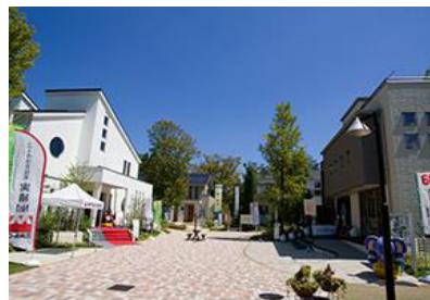
hit 久留米住宅展示場 所在地：久留米市篠山町 397-6 敷地面積：10,190 m 2 区画：14 区画