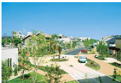
hit マリナ通り住宅展示場 所在地：福岡市西区愛宕四丁目 21 敷地面積：22,902 m 2 区画：31 区画

最新の戸建住宅モデルを紹介する場として、福岡県内4ヶ所に展開する「hit 住宅展示場」を企画・運営しています。展示場内を車で回遊できる斬新な「ドライブパーク方式」を導入するなど、魅力ある展示場作り、ハウスメーカーと連携しながら地域のマイホーム需要に応えています。