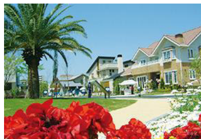
hit 香椎浜住宅展示場 所在地：福岡市東区香椎浜二丁目 8 敷地面積：16,529 m 2 区画：23 区画