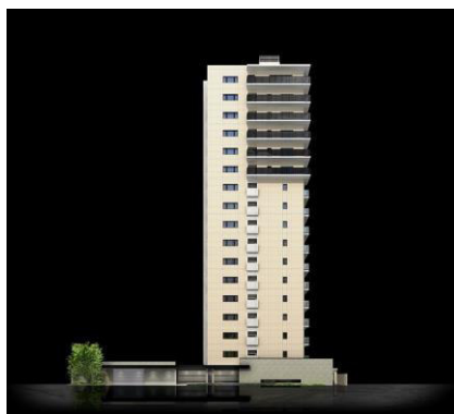
ネクサス大濠（外観）

快適な都市居住の実現を目的に、市場のニーズに応える住まいの企画・開発・販売を行っております。1976年以降4,000戸以上を分譲しており、立地環境や地域性を十分に考慮した商品計画により、質の高いマンションライフの提案がご好評いただいております。