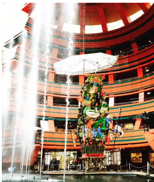
過去の飾り山笠の様子