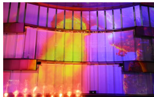
※上演の様子