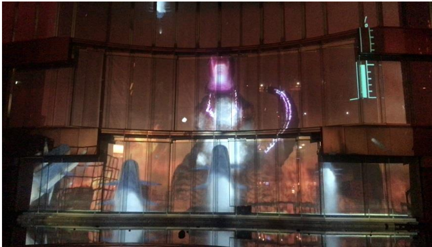
※投影時のイメージ TM&©TOHO CO., LTD.

今回のインタラクティブゲームの開発では、地元福岡の企業とプロジェクションマッピング本編を手掛けた『シン・ゴジラ』本編チームが連携を取り制作に携わっています。お客様がお持ちの携帯端末から攻撃するというシンプルな設定であるがゆえに、違和感なくこれを実現するべく、オリジナルのプログラムを開発しています。 インタラクティブ映像制作：(株)ZEROTEN、インタラクティブプログラム制作：(株)グッドラックスリー